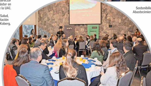
17 empresas e iniciativas fueron distinguidas el pasado martes 13 de agosto en las dependencias de "El Mercurio".