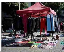
DERRUIDOS.— Sectores de la capital como Meiggs o la Vega Central se han deteriorado de la mano de la actividad informal.