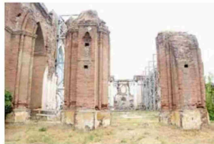
La reconstrucción de la Iglesia San Francisco sigue siendo la gran deuda con la historia curicana.