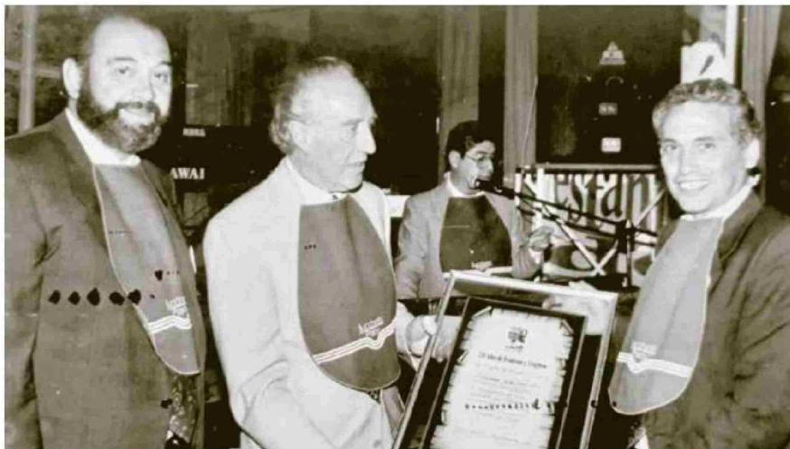
La Prensa recibió el reconocimiento de la Municipalidad de Curicó, por apoyar el programa "Curicó: 250 Años de Tradición y Progreso", en 1993.