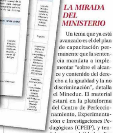
Un tema que ya está avanzado es el del plan de capacitación permanente que la sentencia mandata a implementar "sobre el alcance y contenido del derecho a la igualdad y la no discriminación", detalla el Mineduc. El material estará en la plataforma del Centro de Perfeccionamiento, Experimentación e Investigaciones Pedagógicas (CPEIP), y tendrá una modalidad online asincrónica. Estará dirigido a "equipos directivos y docentes del sistema educativo y personas que se inscriban en el curso", como aquellas encargadas de certificar.

La postura de la Iglesia Católica, continúa Pavez, ha puesto énfasis en la relevancia de la autonomía de las confesiones para establecer la idoneidad de los profesores. Algo que los distintos credos comparten, añade, es que la "idoneidad" no trata solo de conocimientos intelectuales. "Además, el docente debe ser coherente en su vida, con las enseñanzas fundamentales de la respectiva confesión, sin lo