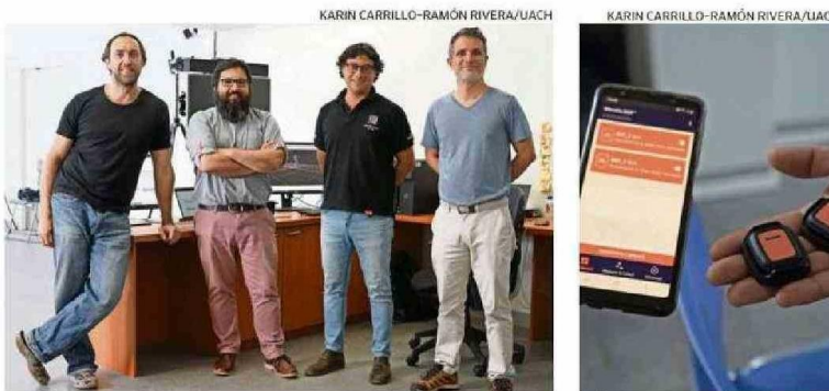
KARIN CARRILLO-RAMÓN RIVERA/UACH

EL DISPOSITIVO INCLUYE SENSORES INERCIALES Y EL USO DE INTELIGENCIA ARTIFICIAL.