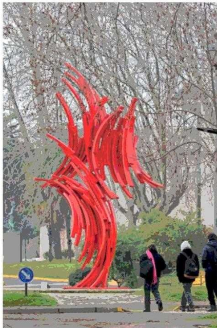
“Talca”, de Sergio Castillo. La obra que dio el puntapié a este proyecto.