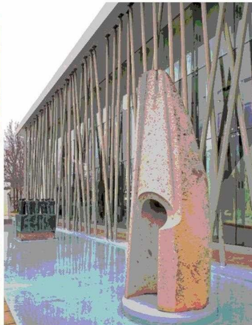
En primer plano: “Flauta precolombina”, de Francisco Gazitúa, en granito.