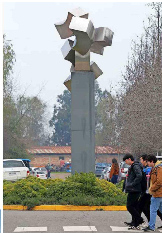
“Nubes cósmicas II”, de Cristiana Pizarro. Obra en acero inoxidable. Mide 6 m de alto.

Tal como dice Pedro Emilio Zamorano, profesor y director del Instituto de Estudios Humanísticos de la universidad, estas cuatro primeras obras “formaron parte de un capital semilla” de un proyecto que en la actualidad reúne 40 piezas monumentales de los más importantes creadores nacionales, emplazadas en lugares estratégicos y respetuosos del master plan del campus desarrollado por el arquitecto y urbanista Marcial Echenique. “Poco a poco se ha construido, con visión de futuro, un patrimonio histórico que rescata a