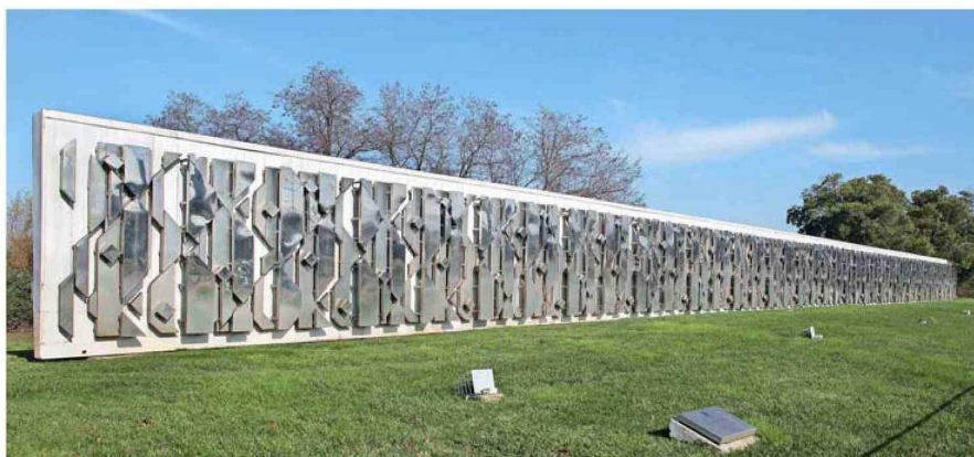
“Friso cinético”, de Matilde Pérez, instalado a la entrada del Campus Lircay de la U. de Talca. La obra es de 1982 y está hecha en acero.

Texto, Beatriz Montero Ward.