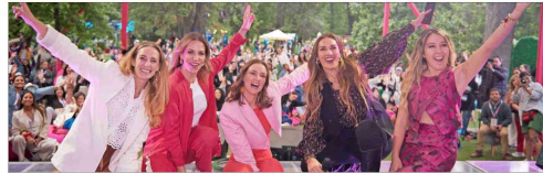
Financiamiento inclusivo, capacitación integral y redes de apoyo: los 3 ejes del petitorio de Fundadoras para potenciar el emprendimiento femenino. 14