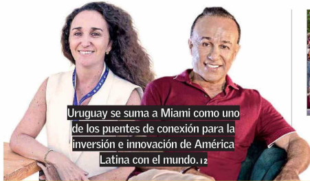
Uruguay se suma a Miami como uno de los puentes de conexión para la inversión e innovación de América Latina con el mundo. 12