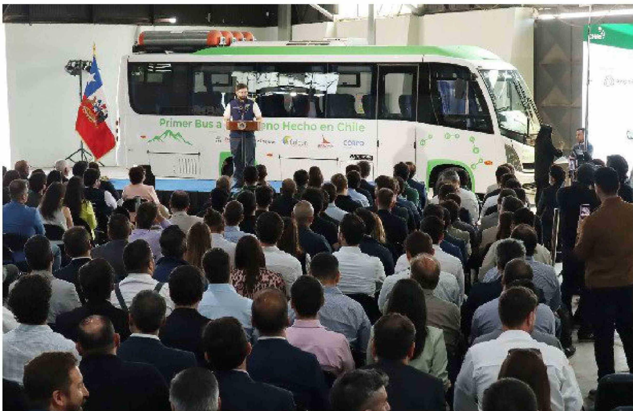
El de Gu Ra la a n