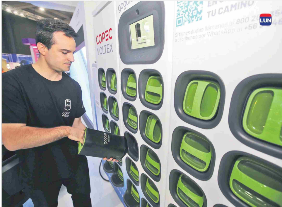
En los centros de intercambio el usuario deja sus baterías vacías y se lleva otras recargadas.

Este servicio no requiere de una persona que atienda a los usuarios: los módulos con las baterías carga-