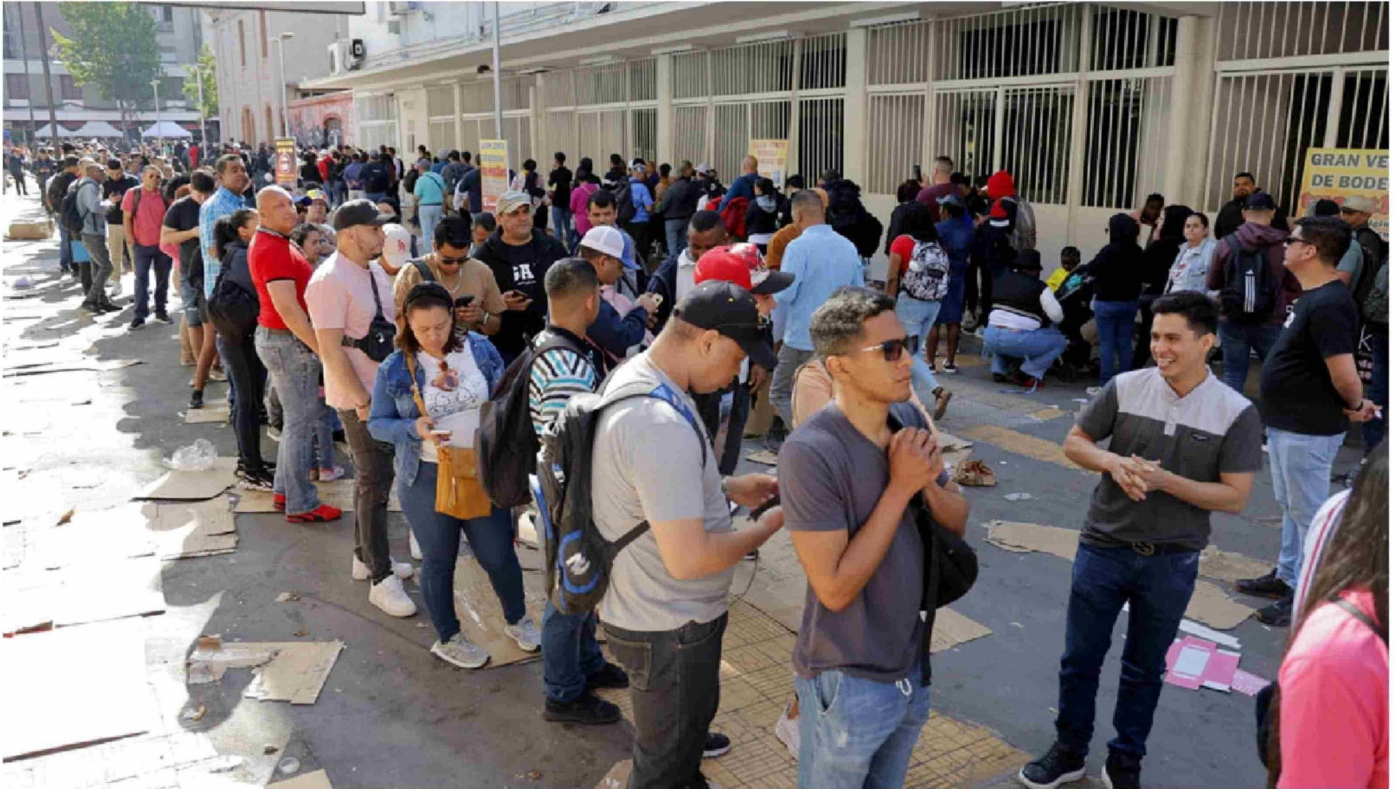
► Imagen del caótico proceso de enrolamiento de extranjeros desarrollado este lunes en el Estadio Víctor Jara.