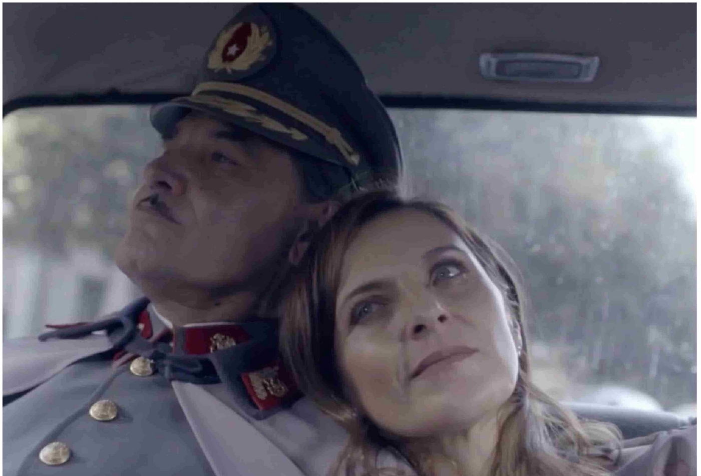
► Sr. y Sra Pinochet es una serie de ficción que sigue a Augusto Pinochet y Lucía Hiriart desde sus orígenes hasta su ascenso al poder tras el golpe de Estado de 1973.