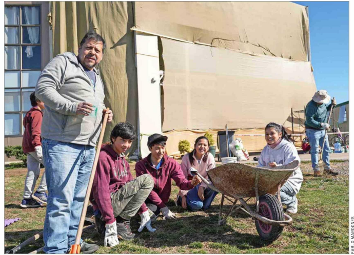
O'HIGGINS. —La comunidad del colegio Trichahue, en Requinoa, inició la limpieza de sus instalaciones, dañadas por la quebradura de vidrios, producto de las fuertes e inusuales ráfagas de viento.

También detalló que en la región de O'Higgins existe interrupción de conectividad en cinco rutas, por la activación de quebradas y aumento de caudales en Santa Cruz. En tanto, informó que en Maule se generó un socavón en la ruta M-854, en Cauquenes, y se registran otras dos rutas alteradas por el desborde de canales. En Biobío, alertó de 800 clientes sin agua en la comuna de Tomé, debido al deslizamiento de ladera que rompió planta de agua potable. En la comuna de Requinoa, en