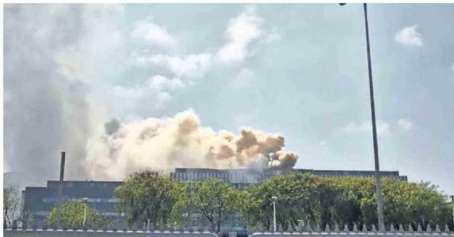
CERCA DE LAS 11 DE LA MAÑANA COMENZÓ EL INCENDIO EN EL CUARTO PISO DEL HOSPITAL REGIONAL DE ANTOFAGASTA.

Además, el reingreso controlado de pacientes y personal comenzó a las 12:16, priorizando la read-