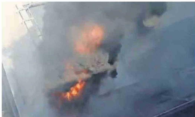
EL INCENDIO INICIÓ CUANDO SE HACÍA MANTENCIÓN DEL SISTEMA DE ENFRIAMIENTO.