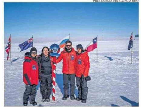
BORIC Y SU COMITIVA EN LA EXPEDICIÓN "ESTRELLA POLAR III".