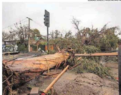
CAÍDA DE ÁRBOL AFECTÓ SUMINISTRO ELÉCTRICO EN LA FLORIDA.

(...) Este viento tan potente es histórico y era muy difícil de predecir que viniera con tanta potencia".