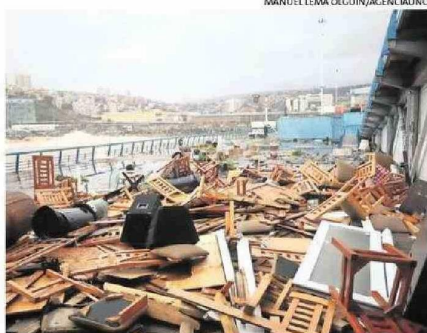
MAREJADAS AFECTARON A UN RESTAURANT EN VALPARAÍSO.