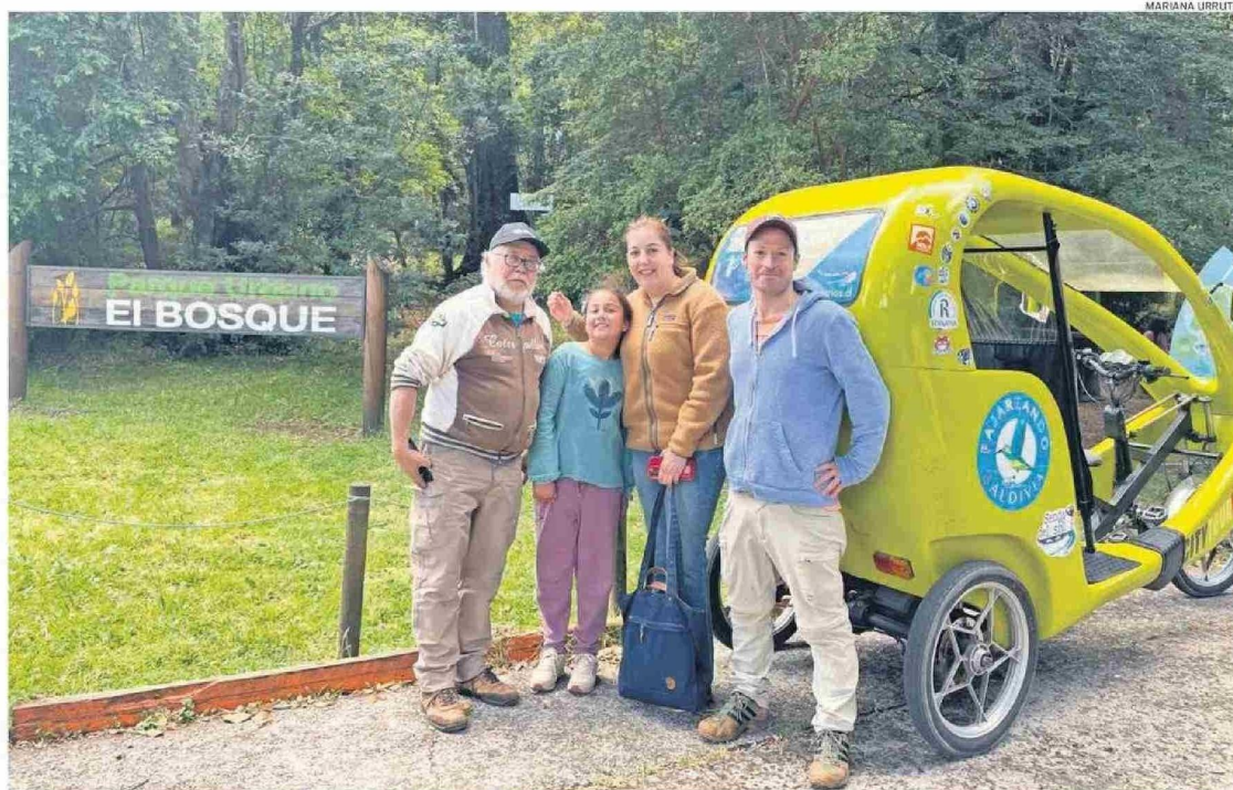
FAMILIAS DE TODO EL PAÍS LLEGAN HASTA EL PARQUE URBANO PARA CONOCERLO. TAMBIÉN ES UN ESPACIO PERMANENTE DE REUNIÓN COMUNITARIA EN VALDIVIA.

La meta es recaudar 70 millones de pesos para finales de diciembre de este año, a través de una propuesta en la cual toda la comunidad puede participar apadrinando un metro