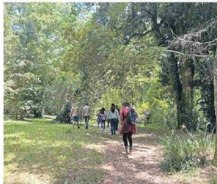
EL PARQUE TIENE 10,5 HECTÁREAS DEDICADAS A LA CONSERVACIÓN.

"Hoy me resulta significativo recordar el hecho que siempre existió como parte de la visión del plan maestro original, dejar parte del terreno, con una clara vocación de conservación y desarrollo de sus prestaciones ecosistémicas naturales. Durante los años en que el Comité Lemu Lahuén ha tenido la responsabilidad de administrar el Parque Urbano, se han desarrollado los actuales senderos y circuitos, sectores de observación y exposición, además de difusión permanente de los beneficios y servicios ecosistémicos que presta actualmente el Parque Urbano a la comunidad y a las personas que acuden regularmente.