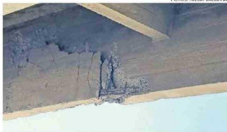
DAÑO HABRÍA SIDO PROVOCADO POR UN CAMIÓN.

“Esta es una situación que lamentablemente tiene para un buen tiempo. Es una situación que se arrastra también desde hace mucho tiempo y que afecta directamente a nuestra comunidad. Quienes estamos inmiscuidos en el servicio público sabemos que desde hace mucho