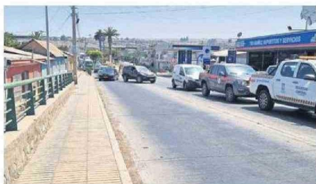
SUSPENSIÓN Y PASO POR SOLO UNA CALZADA PROVOCÓ TACOS.

tiempo que esta era una situación que lamentablemente en algún rato tenía que reventar y lamentablemente nos tocó asumirla a nosotros a pocos días de haber asumido nuestro gobierno como tal”.