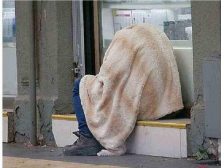
PARA IR EN SU AYUDA, SE PUEDE UTILIZAR EL FONDO CALLE.

"El Estado tiene una deuda histórica sobre cómo abordar el tema de la salud mental, consumo de drogas y alcohol de estas personas que hoy día no permite su reinserción. Por esta razón,