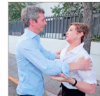
La lista liderada por el exdirector del Sence se impuso con el 57% de los votos, contra un 40% de la actual timonea, Gloria Hutt.

Intercambian 200 prisioneros por cuatro rehenes En un segundo intercambio desde que acordaron un alto el fuego, Israel liberó ayer a 200 prisioneros palestinos a cambio de cuatro mujeres militares que permanecían secuestradas por la milicia de Hamas en la Franja de Gaza desde octubre de 2023. Es un “momento muy feliz que hemos estado esperando durante mucho tiempo”, dijo el Primer Ministro de Israel, Benjamin Netanyahu, quien aseguró que trabajan para “liberar a todos los demás”. | A 5