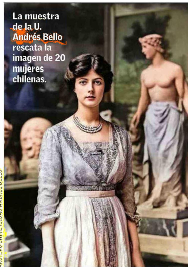
La muestra de la U. Andrés Bello rescata la imagen de 20 mujeres chilenas.

Durante marzo se reconocerá el trabajo de mujeres artistas y, a la vez, se honrará a aquellas que fueron líderes en el pasado. En la biblioteca de la casa de la U. Andrés Bello (Fernández Concha 700) se inaugurará el próximo jueves la exposición “Rostros de mujeres en la historia de Chile”, realizada por la decana de Educación y Ciencias Sociales, Gabriela Huidobro, y la fotógrafa Carolina Corvalán. La muestra, compuesta por 20 fotografías —de ellas, más de la mitad viene de registros fotográficos, mientras que las demás corresponden a pinturas e ilustraciones digitalizadas—, honra a personajes femeninos de la historia nacional, como Rebeca Matte, Carmen Arriagada, Rosario Orrego y Martina Yáñez Borgoño. Estará abierta hasta el 25 de abril y la entrada es gratuita.