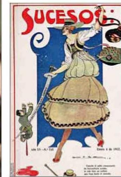
La Biblioteca Nacional investigó a las redactoras de la revista Sucesos.

En estas fechas, además, en la Casa-Museo Santa Rosa de Apoquindo (Padre Hurtado Sur 1195) se presenta una muestra de las