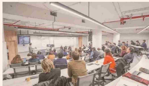
Vista general del encuentro.