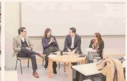
Panelistas en el encuentro.