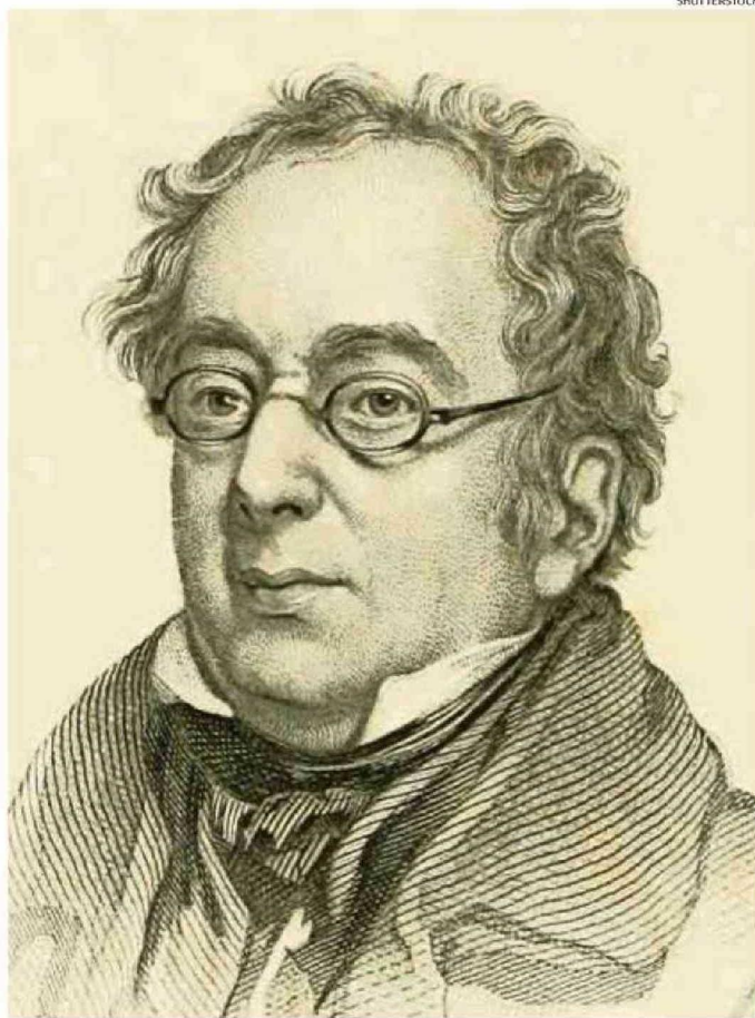
ISAAC DISRAELI PUBLICÓ "CURIOSIDADES DE LA LITERATURA" EN CUATRO TOMOS, ENTRE 1791 Y 1823.