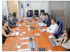
Por casi dos horas sesionó la instancia, compuesta por seis autoridades que sustituyeron a los titulares.

"Subrogantes" de ministros Comité del Gobierno vota nuevamente en contra de Dominga: uno de sus integrantes ya se había opuesto al proyecto minero