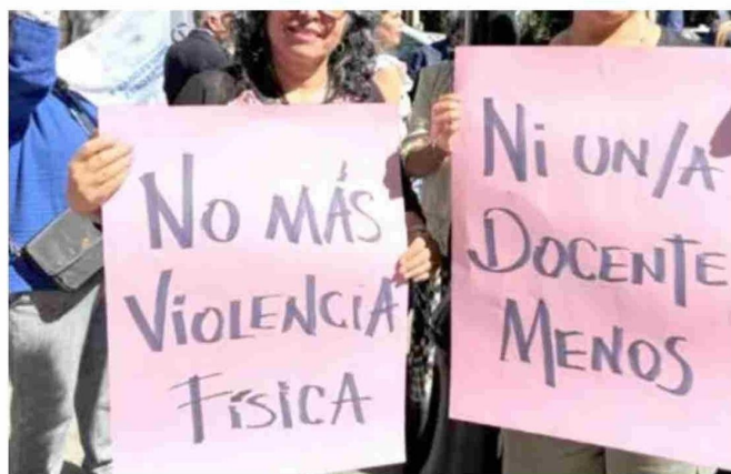
Una nueva movilización anuncia el Colegio de Profesores, programada para el lunes 24 de marzo.

Gobierno y a los parlamentarios que se agilicen las leyes y los dineros, para dar respuesta a niños y jóvenes con necesidades educativas especiales", enfatizó.