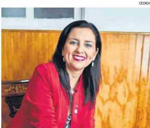
CAROLINA MOSCOSO ACTUALMENTE ES CONSEJERA REGIONAL.