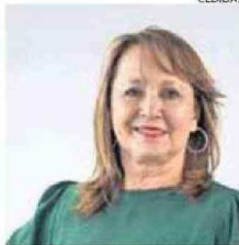
HA SIDO ALCALDESA HASTA MINISTRA.

En 2008 fui candidata independiente a la alcaldía de Antofagasta y resulté electa con el 51,4% de los votos. Desde la municipalidad impulsé más de 20 obras de mejoramiento territorial, entre las que destacan la remodelación del Estadio Regional, la construcción del Estadio Escolar, el Paseo Angamos, el Liceo Científico Humanista de La Chimba, la cancha de Las Almejas, la intervención en sedes vecinales y multicanchas,