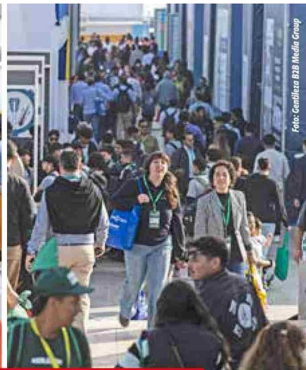
De Izq. a Der.: Más de 1.100 expositores y participación de 32 países. Treintena de países visitantes y 1.146 empresas expositoras.

Quien también intervino fue el Asset President Escondida|