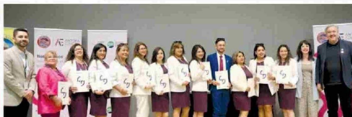
Profesores de la Escuela Valentín Letelier D-131 de Calama reciben sus diplomas TAMK (Universidad de Ciencias Aplicadas de Tampere, Finlandia).