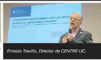
Colaboración para la mejora continua: desarrollo profesional, aprendizaje y bienestar Noviembre 2024