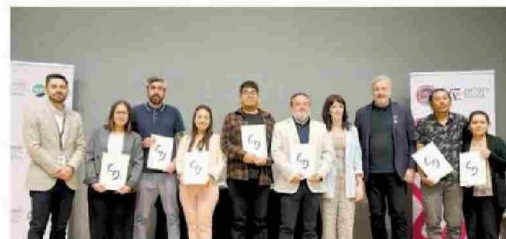
Entrega de diplomas TAMK a profesores del Complejo Educacional de Toconao de San Pedro de Atacama.