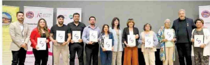
Entrega de diplomas TAMK a profesores del Liceo Técnico Profesional Científico Humanista de María Elena.