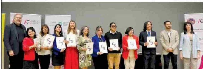
Entrega de diplomas TAMK a profesores de la Escuela Presidente Balmaceda D-48 de Calama.