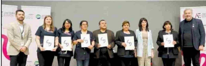
Profesores del Complejo Educacional de Toconao de San Pedro de Atacama reciben sus diplomas TAMK (Universidad de Ciencias Aplicadas de Tampere).