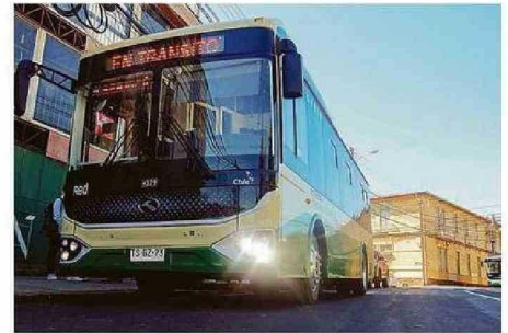
CAMINO A LA MODERNIDAD NO HA COBIJADO A LAGUNA VERDE.