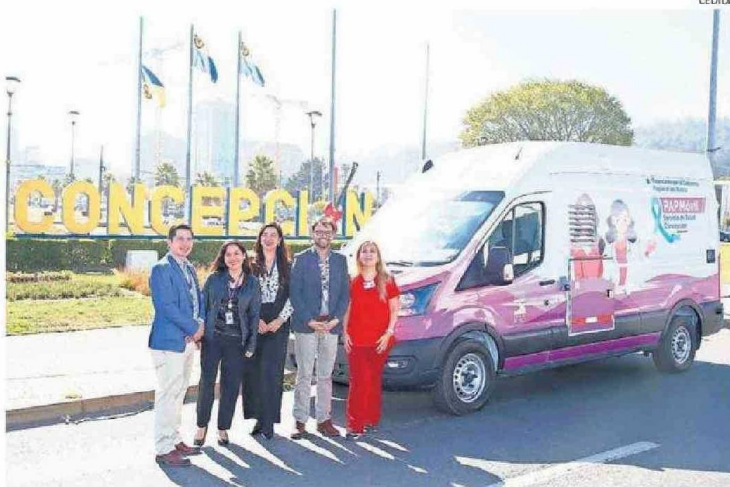
LA HABILITACIÓN DEL MÓVIL SIGNIFICÓ UNA INVERSIÓN PÚBLICA DE 71 MILLONES DE PESOS.