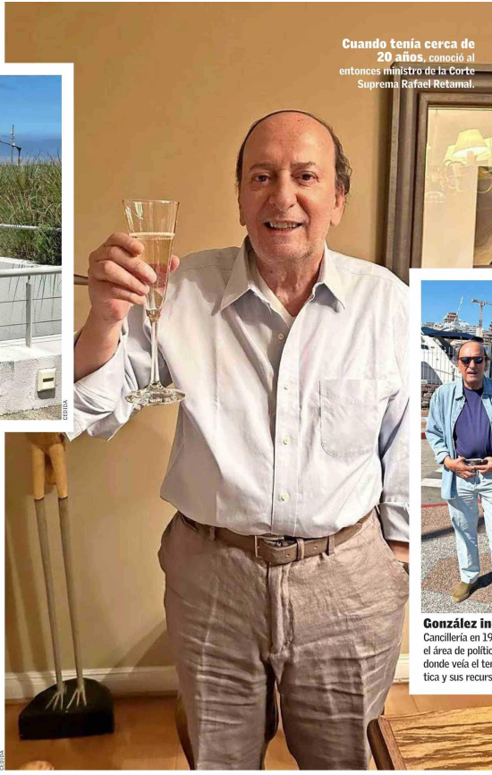
Quando tenía cerca de 20 años, conoció al entonces ministro de la Corte Suprema Rafael Retamal.

Comenzó luego a frecuentar a Domingo Kokisch, el ministro de la Corte Suprema que tenía más pelus con la prensa, con quien afirma que hizo gran amistad y también con su mujer, Malvina. Cuando murió, en 2006, lo llamó la familia y ahí estuvo él, apoyando al ministro Haroldo Brito—que era casi como hermano de Kokisch y que en 2018 asumió la presidencia de la Suprema—, que se encargó de hacer todos los trámites. Esa noche de su muerte, recuerda, llegaron a la casa del difunto en La Reina todos los ministros de la Corte; entre ellos, Milton Juica (presidente de la Suprema entre 2010 y 2012). Y él estaba en medio, y se hizo conocido en el círculo.