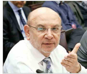
Juan Luis Castro, senador del P. Socialista.