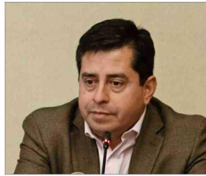
Pedro Araya, senador del comité PPD.