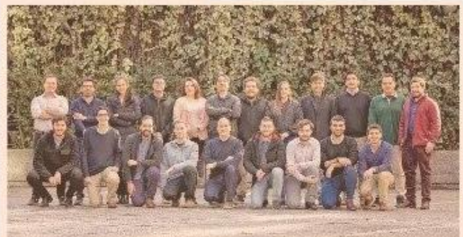
La tecnología de Sisua Digital agrega un valor importante a la operación, porque puede hacer análisis con inteligencia artificial y machine learning.

Para más información visite www.sisudigital.com