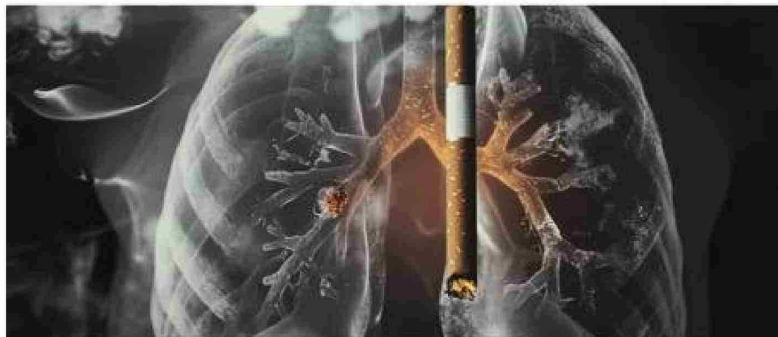
Se usaron datos del Observatorio Mundial del Cáncer sobre los casos de cáncer en 185 países/territorios de todo el mundo.

los hombres participan menos en actividades de prevención del cáncer subutilizan las opciones de tests y tratamientos enfrentan una mayor exposición a factores de riesgo como el tabaquismo, el consumo de alcohol y la exposición laboral a agentes cancerígenos