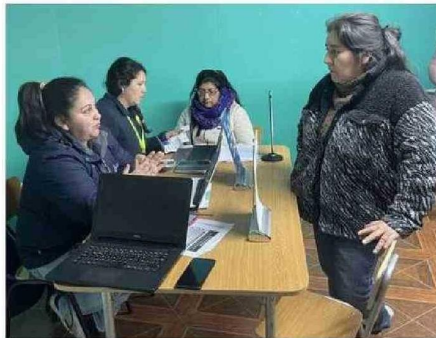
ATENCIÓN A VECINOS EN LA COMUNA DE QUINCHAO PARA INTERESADOS EN TRANSMITAR LA AYUDA.

los días que queda, el Ministerio de Energía informó que a través de las oficinas de ChileAtiende también se puede postular y sin necesidad de tener Clave Única, entonces eso también va a ser un aliciente porque muchas personas manifestaban tener complejidades con eso”.