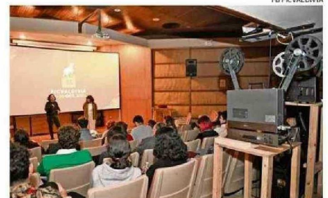
LA PARANINFO UACH FUE UNA DE LAS SALAS DEL EVENTO.