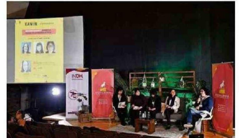
UNO DE LOS CONVERSATORIOS DEL CICLO KAWIN EN EL CECS.