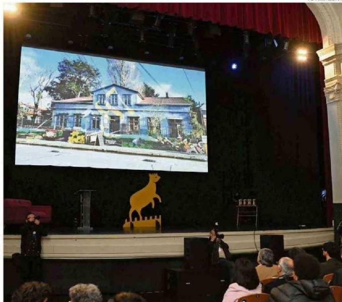
EL EVENTO ESTUVO MARCADO POR EL RECUERDO DEL INCENDIO QUE ACABÓ CON LA CASONA DE PÉREZ ROSALES N°787.