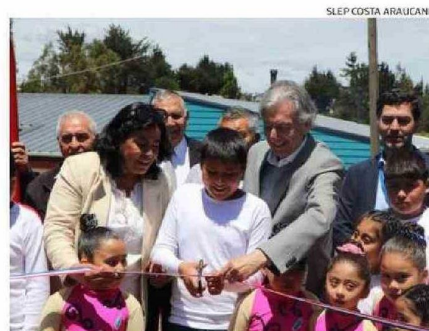
AUTORIDADES Y LA COMUNIDAD EDUCATIVA EN EL CORTE DE CINTA.