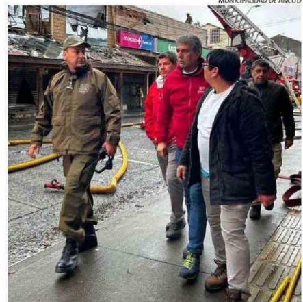
MUNICIPALIDAD DE ANCUD