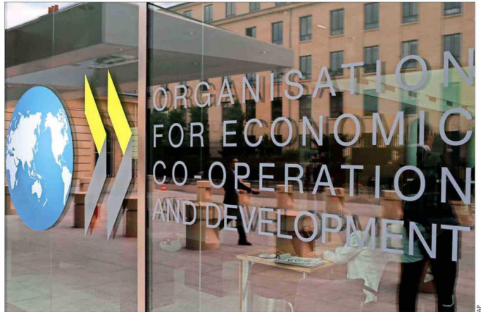
La OCDE hoy está integrada por 38 Estados, entre los que figura Chile.