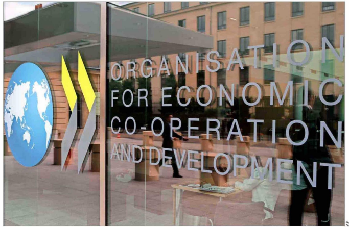
La OCDE hoy está integrada por 38 Estados, entre los que figura Chile.