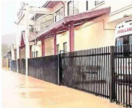
EL RECINTO LOTINO FUE INUNDADO POR LAS FUERTES LLUVIAS.