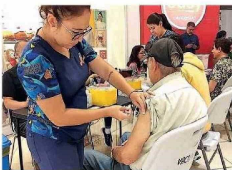
SALUD INSISTIÓ EN EL LLAMADO A VACUNACIÓN.

“Se trata dijo de personas que no se vacunaron y que declaran categóricamente que ahora sí se inocularán cada año y de manera tem-