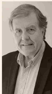
PATRICIO MELERO EXMINISTRO DEL TRABAJO Y PREVISIÓN SOCIAL

“(La PGU y el Pilar Solidario) son instrumentos valiosos del sistema de pensiones. Ambos han contribuido a aliviar la pobreza, que es su objetivo base, sobre todo en los quintiles más vulnerables y son expresión de acuerdos que honran la política”.