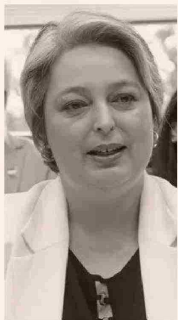
JEANNETTE JARA MINISTRA DEL TRABAJO Y PREVISIÓN SOCIAL

“(La PGU y el Pilar Solidario) son instrumentos valiosos del sistema de pensiones. Ambos han contribuido a aliviar la pobreza, que es su objetivo base, sobre todo en los quintiles más vulnerables y son expresión de acuerdos que honran la política”.