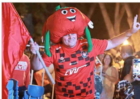
Vestidos como su tradicional tomate, los limachinos coparon el estadio para lentar a su equipo.