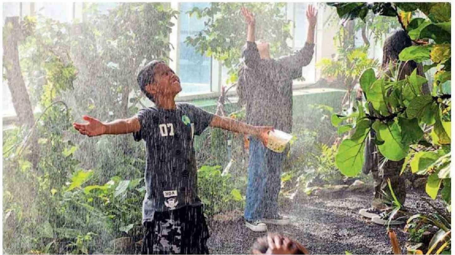
EL JARDÍN BOTÁNICO DE AGUAS ANTOFAGASTA CUENTA CON 10 ÁREAS TEMÁTICAS, QUE OCUPAN 3.200 M2 DE ÁREAS VERDES.

Grandes y chicos disfrutarán allí de una espectacular naturaleza, junto a más de 560 especies nativas en el árido norte del país. Quienes participen de la cita para recorrer las instalaciones "encontrarán inspiración de sobra en esta actividad organizada por el evento literario que cumple 15 versiones este año y