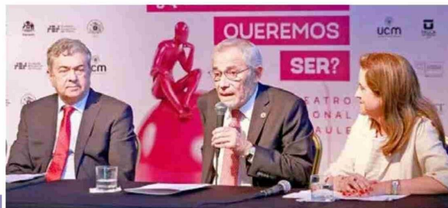
El Congreso del Futuro es posible gracias a la unidad de las universidades de Talca, Católica del Maule, Santo Tomás y Autónoma. Sus autoridades destacaron que se trata de una oportunidad de desarrollo única para la región.

gulo formado entre tecnología, democracia e información, así como el espacio y la opinión pública se transforman a causa de las interacciones entre ellas. Su propuesta será debatida por doctores en lengua, tecnología y sociología con vasta formación en la materia.