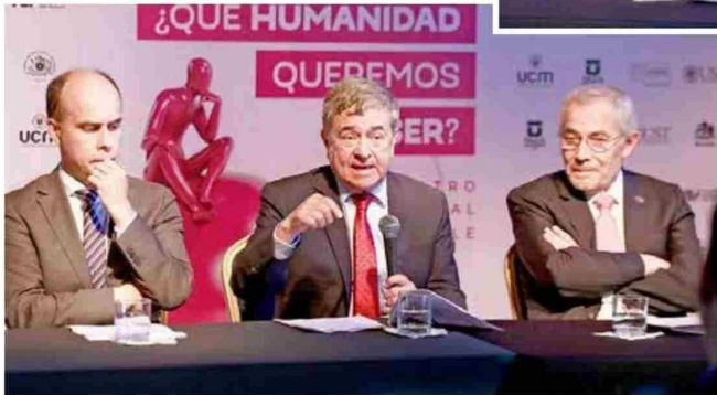
El senador Juan Antonio Coloma en su rol de presidente de la Comisión Desafíos del Futuro, Ciencia, Tecnología e Innovación de la Cámara Alta, afirmó que el encuentro planteará cómo se armoniza la tecnología de la información con nuestro desarrollo.