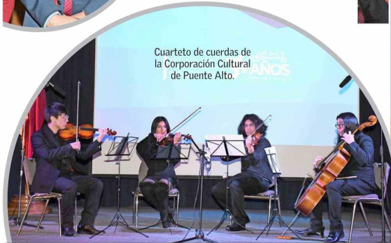
Cuarteto de cuerdas de la Corporación Cultural de Puento Alto.