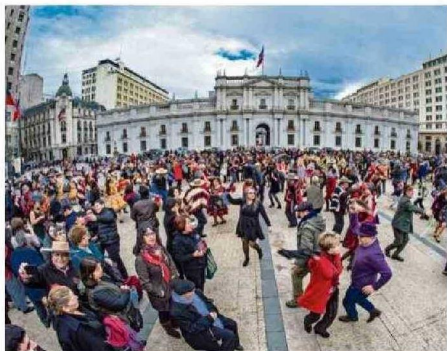
CELEBRACIÓN DE LA DECLARACIÓN DEL DÍA DEL CUEQUERO Y LA CUEQUERA, FRENTE AL PALACIO DE LA MONEDA, SANTIAGO (2018).

Miramos a través del lente de una constante arquitecta de la representación estética. Su labor con la cámara la sitúan como protagonista de lo que hoy sucede en el folclor chileno.