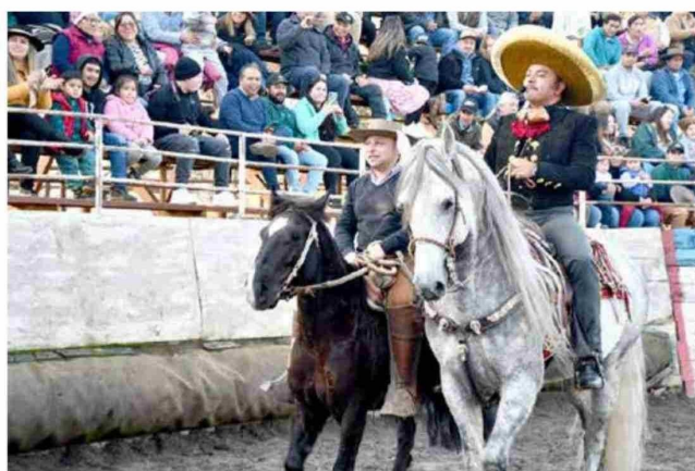
Alcalde Osvaldo Jorquera destacó gran nivel de la actividad.