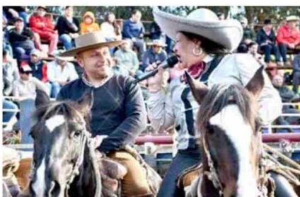
El cantar rancho fue del deleite de los asistentes.