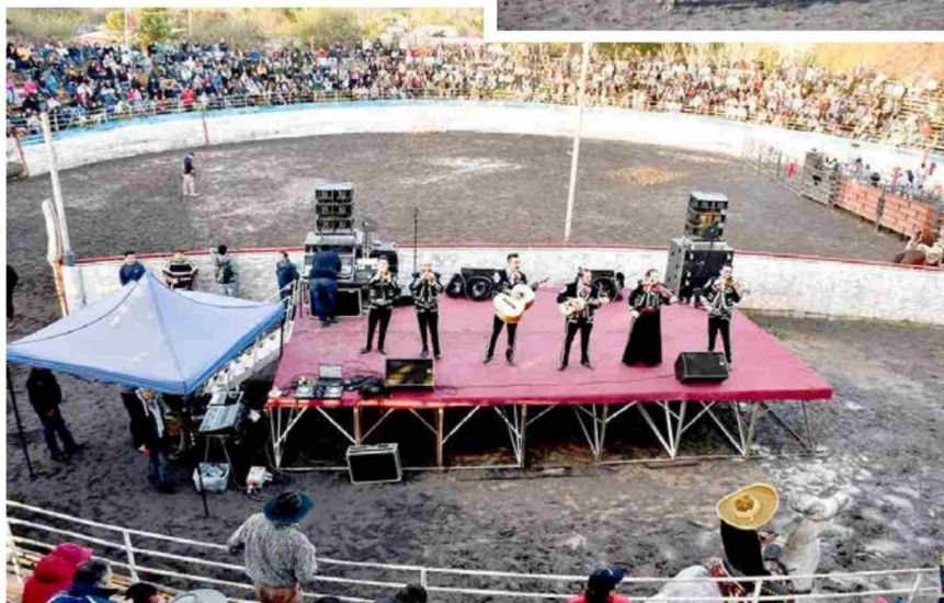
Evento se desarrolló en medialuna de Villa Prat.