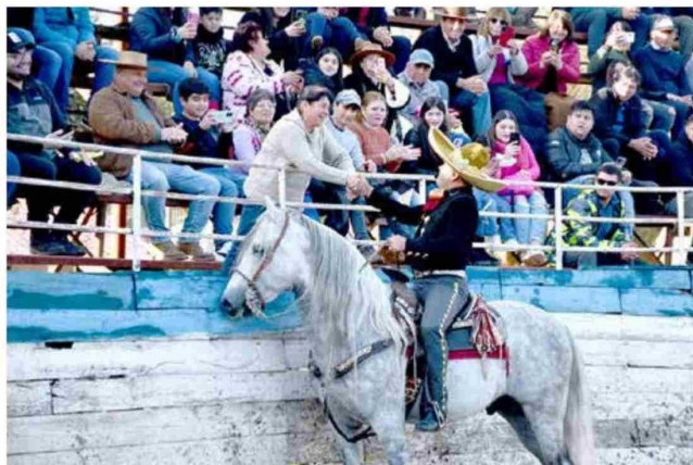
Jefe comunal compartió con los asistentes.

muy bien, a pesar que pensábamos que quizás el día no nos iba a acompañar, pero gracias a Dios estuvo todo espléndido; muy, muy bien, con un espectáculo de primer nivel, que los papás disfrutaron y la gente se fuera muy contenta", afirmó.