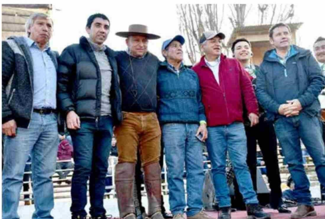
El cuerpo de concejales junto a los vecinos de la comuna.