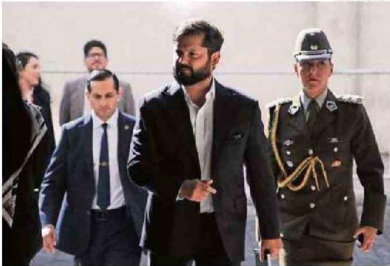
EL PRESIDENTE ESTÁ IMPUTADO POR UNA QUERRELLA EN SU CONTRA.