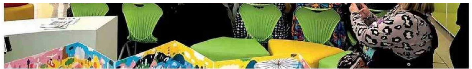
EN CALAMA, EL TALLER DE MEDIACIÓN LECTORA FUE REALIZADO EN EL COLEGIO GUADALUPE DE AYQUINA.

En las instancias se entregaron herramientas de mediación lectora a quienes están a cargo de los espacios dedicados a fomentar la lectura en las unidades educativas, "además de abordar temas primordiales como el Plan de Reactivación Educativa, la Política Nacional del Libro