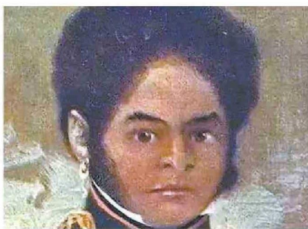
EL CORONEL GUILLERMO BARCALA, PARTIDARIO DE LA UNIÓN CON CHILE, FUE FUSILADO EN 1835.

Por carta, un grupo de connotados ciudadanos mendocinos le sugirió al ministro Diego Portales unirse a Chile, pero el Ministro rechazó tal proposición.